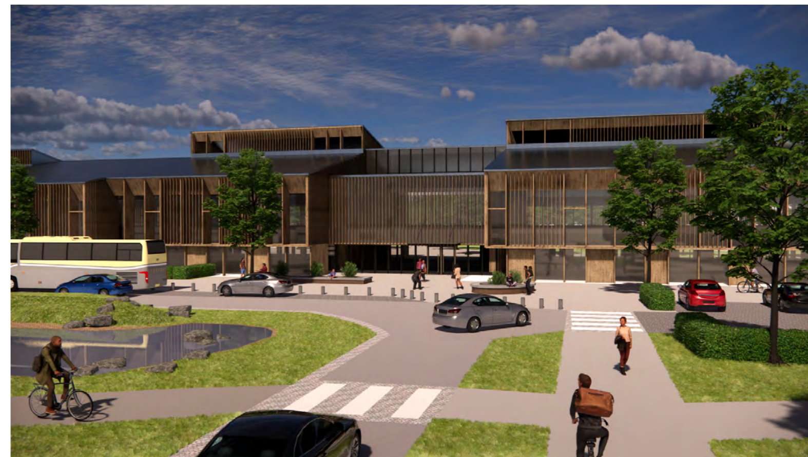
Illustration: Vy från sydväst