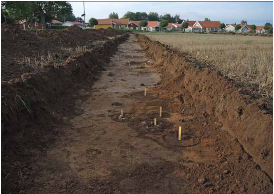
Figur 6. Schakt 1532 med arkeologiska anläggningar. Foto mot söder.