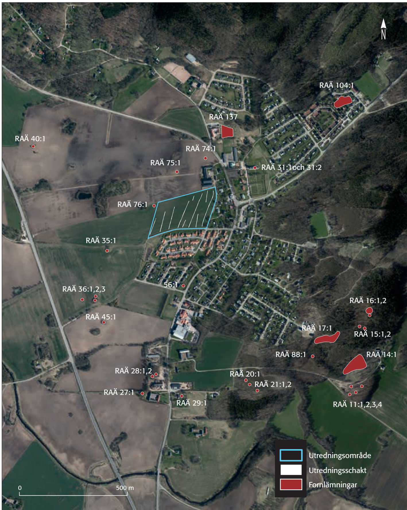
Figur 1. Ortofot, utsnitt för utredningsområdet inom fastigheten Kvibille 21:1, Kvibille socken med fornlämningar inom en kilometer markerade. Skala 1:10 000.