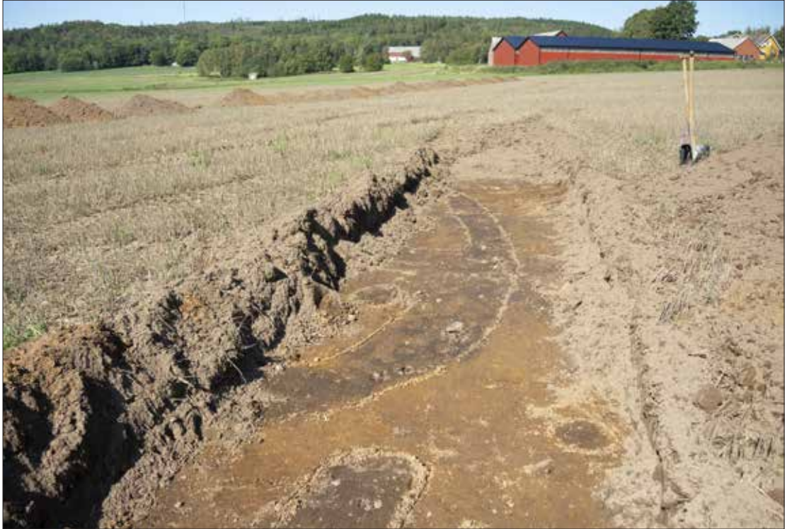
Figur 5. Schakt 734 med arkeologiska anläggningar. Foto mot norr. (fotonr. 2018-65-5).