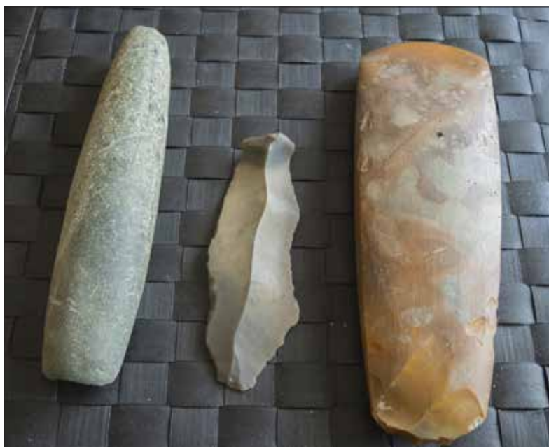
Figur 2. Fotografi på fynd påträffade i närområdet till utredningsområdet. Från vänster håleggad bergartsyxa i grönsten RAÄ 74:1, spånkrapa 75:1 och tunnackig flintyxa 76:1.

I närområdet på cirka en kilometer från utredningsområdet finns ett flertal fornlämningar bestående av boplatser, gravar och gravfält. I nordost finns bebyggelse lämningar från ett sentida torp, RAÄ 104 och i norr finns boplatzlämningar av förhistoriska hus från yngre bronsålder och äldre järnålder, RAÄ 137. Närmare utredningsområdet mot norr har fynd