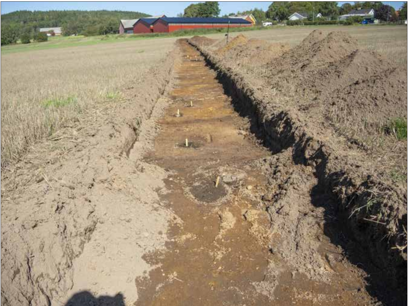
Figur 4. Schakt 431 med arkeologiska anläggningar. Foto mot norr.

Schakt 1756. Längd 23 meter. Area 38 kvadratmeter. Matjordslagrets djup 0,3 Underliggande markmaterial lerig siltig sand med rostjordsinslag.